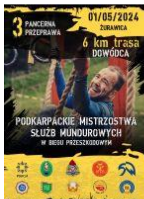
Bieg z przeszkodami

W bieżącym roku objęliśmy swoim patronatem kilka ciekawych imprez sportowych: