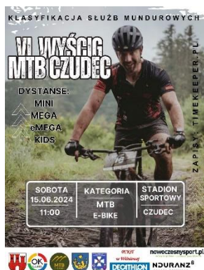
Wyścig rowerowy MTB