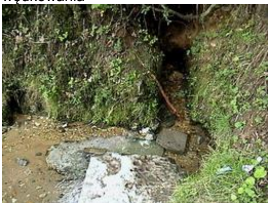
Źródło w Czarnym Lesie

Obszar Domaniewic rozciąga się z północy na południe. Północna część sołectwa tzw. Czarny Las znajduje się na terenie Jurajskiego Parku Krajobrazowego "Orlich Gniazd" i położona jest w dolinie Sączy (Tarnówki). Rzeką tą wypływa z urokliwego źródła, w którego wodach przetrwał bardzo rzadko występujący w Polsce wypławek alpejski. Liczące 402 mieszkańców Domaniewice stanowią dobrą bazę wypadową do najatrakcyjniejszego zakątka gminy - Doliny Wodącej. W 2005 roku na obszarze Doliny Wodącej wytyczono nowy pieszy trakt turystyczny - Szlak Jaskiniowców. Znajdują się tu ośrodki z bazą noclegową i gastronomiczną, boisko sportowe oraz zalew rekreacyjny, doskonale nadający się do wędkowania