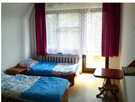
Pokoje 2/3 osobowe

W pobliżu płynie rzeka. Wokół rozciąga się wspaniały pagórkowaty krajobraz. W okolicy jest możliwość grzybobrania oraz zbierania owoców leśnych.