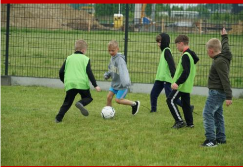
Zażarty bój piłkarski...