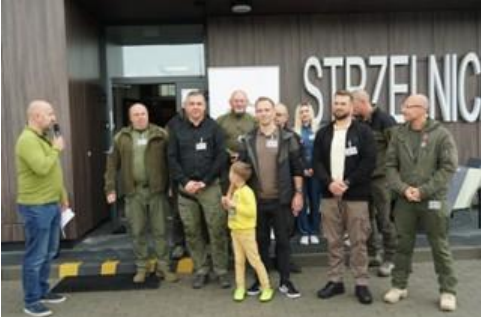
Zespół zaangażowanych w realizację

Realizacja tego typu przedsięwzięć jest możliwa dzięki zaangażowanym osobom, które poświęcają swój wolny czas dla innych i znajdują w tym satysfakcję. Dziękujemy.