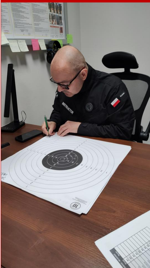
Sędzia główny zawodów podczas pracy. Skrupulatnie odnotowuje wszystkie wyniki.

Jako pierwsi rywalizację rozpoczęli dorośli. W tej kategorii uczestników wzięło udział 31 osób. Strzelali w postawie stojącej z broni krótkiej kal. 9x19mm marki Glock. Tarcza TS-2 znajdowała się w odległości 15 metrów. Każdy zawodnik oddał 10 strzałów próbnych oraz 10 turniejowych, które były uwzględniane w klasyfikacji turniejowej.