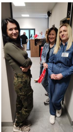
Oczekiwanie na swoją kolej...