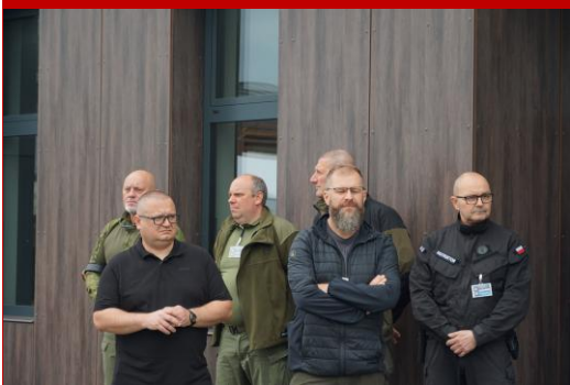
Większość instruktorów czuwających nad bezpiecznym przebiegiem turnieju stanowili funkcjonariusze podkarpackiej SCS.

W kategorii młodzieży w wieku od 13 do 18 lat wzięło udział 12 osób. Strzelali w postawie stojącej z broni krótkiej kaliber 22 LR boczego zapłonu. Tarcza TS-2 znajdowała się w odległości 10 metrów. Każdy zawodnik oddał 10 strzałów próbnych oraz 10 turniejowych, które były uwzględniane w klasyfikacji turniejowej.