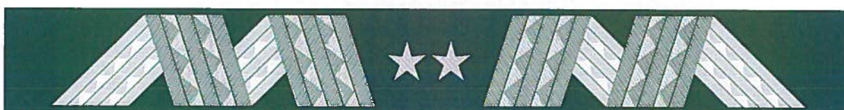
generał – otok kapelusika