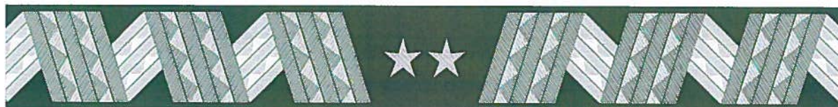
generał – otok czapki wyjściowej