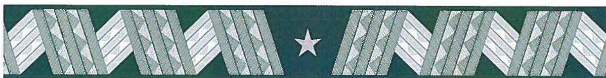
nadinspektor – otok czapki wyjściowej