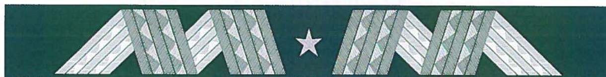
nadinspektor – otok kapelusika