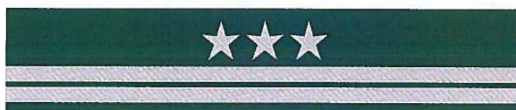
inspektor – otok kapelusika